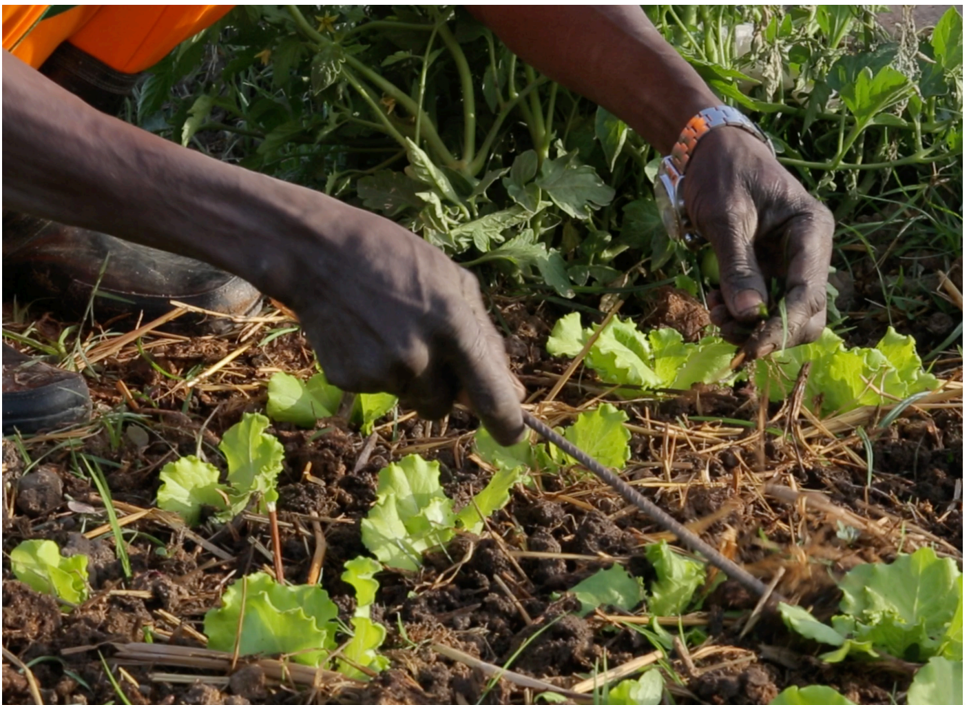
Un agriculteur à Kollo

Pour réaliser ce travail, la Direction des curricula et programmes a mis à contribution les professionnels de plusieurs secteurs concernés, ceux exerçant le métier, leurs supérieurs hiérarchiques, les ministères dont relèvent ces métiers, les organisations professionnelles des employeurs et des travailleurs, les institutions de formation qui enseignent ces métiers etc. C'est cet ensemble de spécialistes qui a eu à décrire spécifiquement